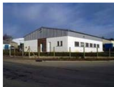
Bâtiment de 292 m 2 de type industriel à Flers

2X 150 m 2 de bâtiment de type industriel - Voir bâtiment 1 - Voir bâtiment 2