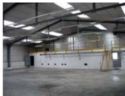
Bâtiment de 4897 m 2 à la Ferté Macé

Voir toutes les autres offres sur le site Entreprendre dans l'Orne